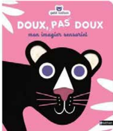
Hector Dexet - Doux, pas doux : mon imagier sensoriel Édition Nathan Jeunesse, 2016