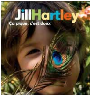
Jill Hartley - Ça pique, c'est doux Édition Didier Jeunesse, 2012